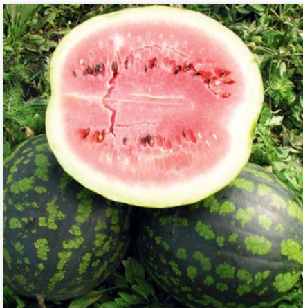
Рис. 3. Плоды арбуза сорта Холодок

двух сортов также способствовало увеличению средней массы плодов от 3,0% у сорта Холодок до 9,2% у сорта Триумф. У сортов Икар и Импульс прибавка по этому показателю составляла 4,0 и 4,7%, а у гибрида F_1 Романза отсутствовала.