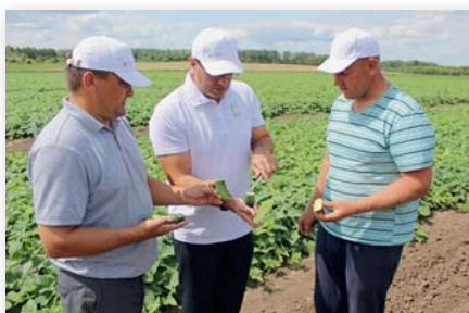
Экспертная оценка гибрида огурца F 1 Энеж 21