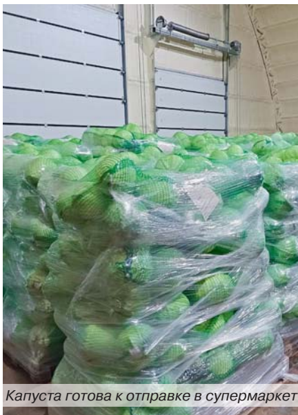
Капуста готова к отправке в супермаркет

развитие материально-технической базы, например, кооператив «Возрождение». Эта финансовая поддержка позволила запустить переработку мяса и ускорить развитие, тем самым эффективнее работать на благо своих членов-пайщиков.