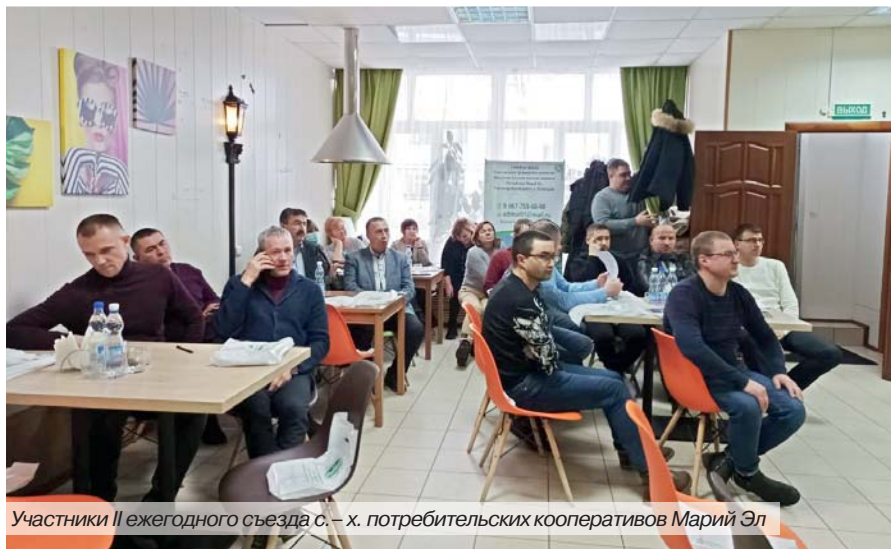
Участники II ежегодного съезда с.-х. потребительских кооперативов Марий Эл

Ряд кооперативов республики воспользовался этой поддержкой, и здесь большую роль сыграла рабо-