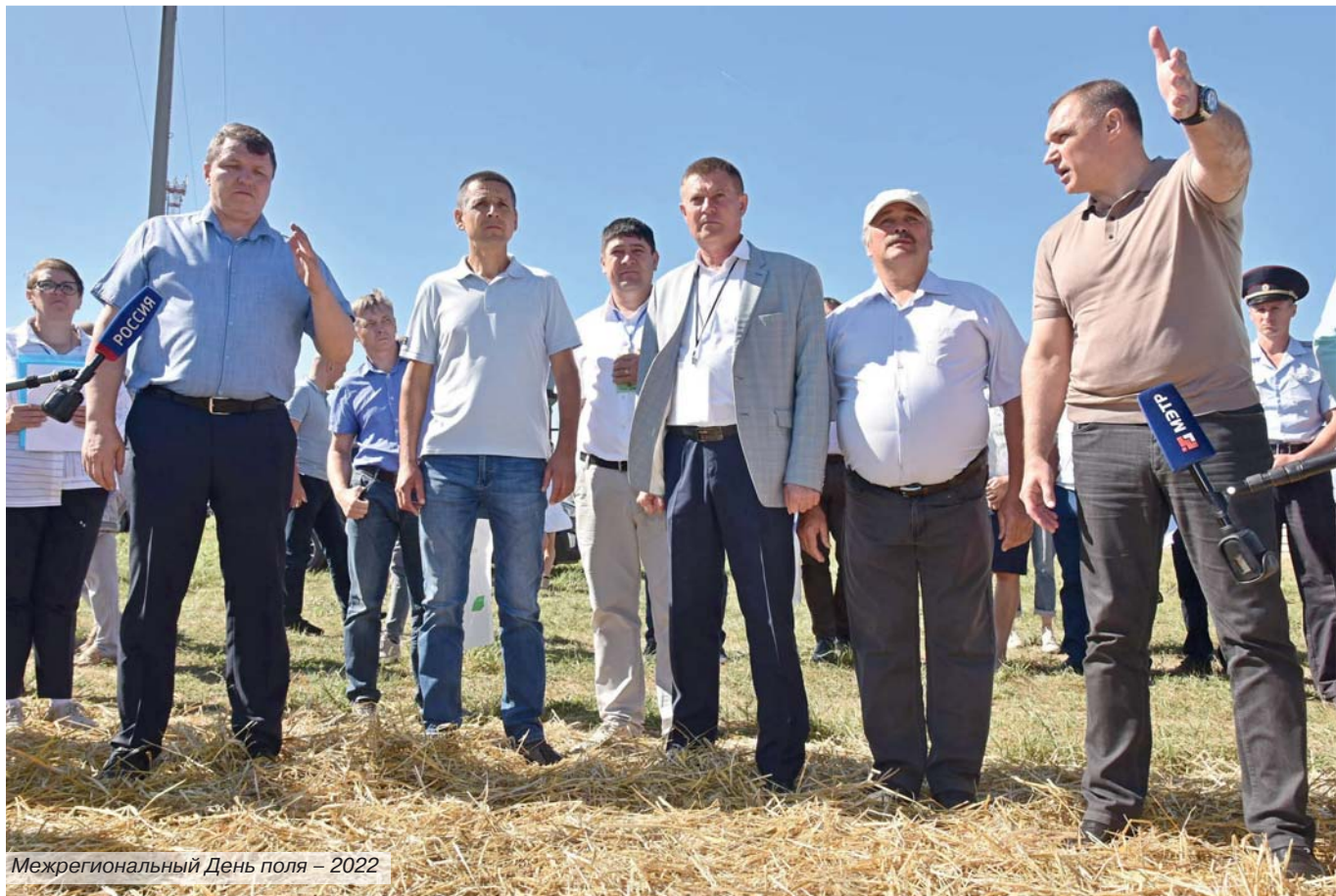
Межрегиональный День поля – 2022

нести преимущества кооперации до населения сельских территорий и товаропроизводителей.