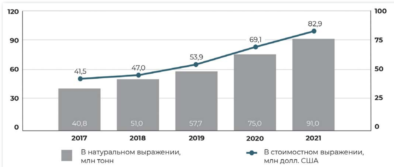
Рис. 4. Экспорт консервированных овощей России, 2017–2021 годы.

жении и на 18,9% в стоимостном (рис. 4).