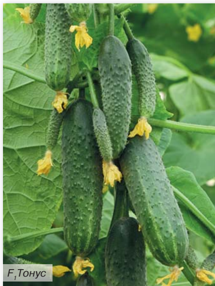
F 1 Тонус

к болезням: вирусу табачной мозаики, вертициллезному и фузариозному увяданиям. Он отлично переносит транспортировку на большие расстояния, подходит и для переработки, и для реализации в свежем виде.