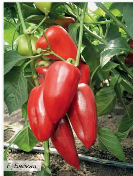
F 1 Байкал

Год от года Агрофирма радует потребителей конкурентоспособными высокоурожайными сортами и гибридами овощных культур. Например, особый интерес в столице Кривянской (Ростовская область) в этом году вызвал гибрид томата F 1 Армада . Несмотря на дождливую весну, которая спровоцировала вспышку грибных заболеваний, и перепады температур, этот среднеспелый (110–115 дней) гибрид индетерминантного типа подарил труженикам столицы высокий урожай крупных томатов. Плоды массой 280–300 г, плоскоокруглые, выровненные по размеру и форме, плотные, гладкие, ярко-красные, с нежной, сочной мякотью насыщенного вкуса. Гибрид F 1 Армада прекрасно растет на засоленных почвах, а его плоды подходят для реализации на перерабатывающие предприятия. Кстати, он пришелся