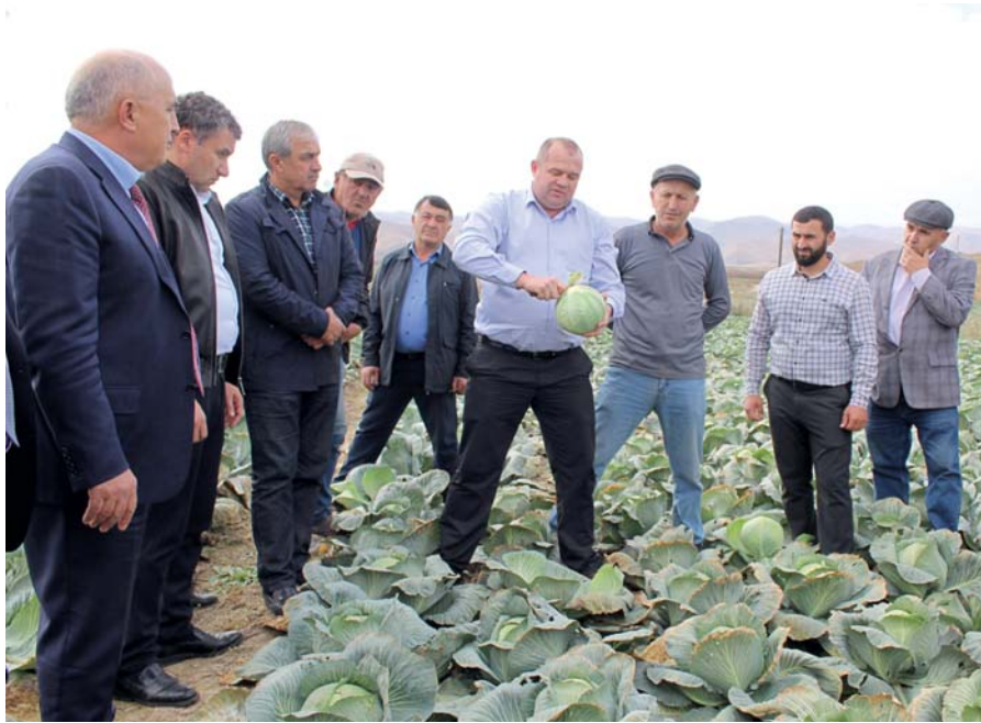
Участники мероприятия оценивают F 1 Универс