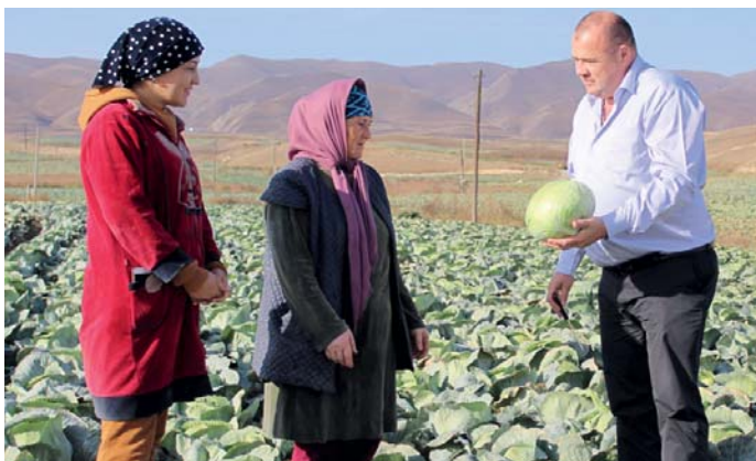
Фермеры заинтересовались гибридом F 1 Континент