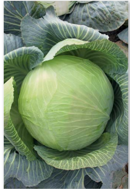
F 1 Кавказ