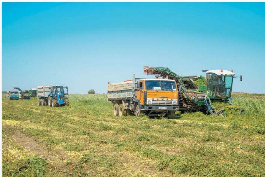
Механизированная уборка томата

Развиваются и молодые предприятия. Так, в Астрахани второй год работает ООО «Билд», которое постепенно расширяет производственные мощности. На производстве занимаются заморозкой местных астраханских овощей: перца, баклажана, томата. В настоящее время ООО «Билд» ориентировано на оптовые поставки продукции. В планах