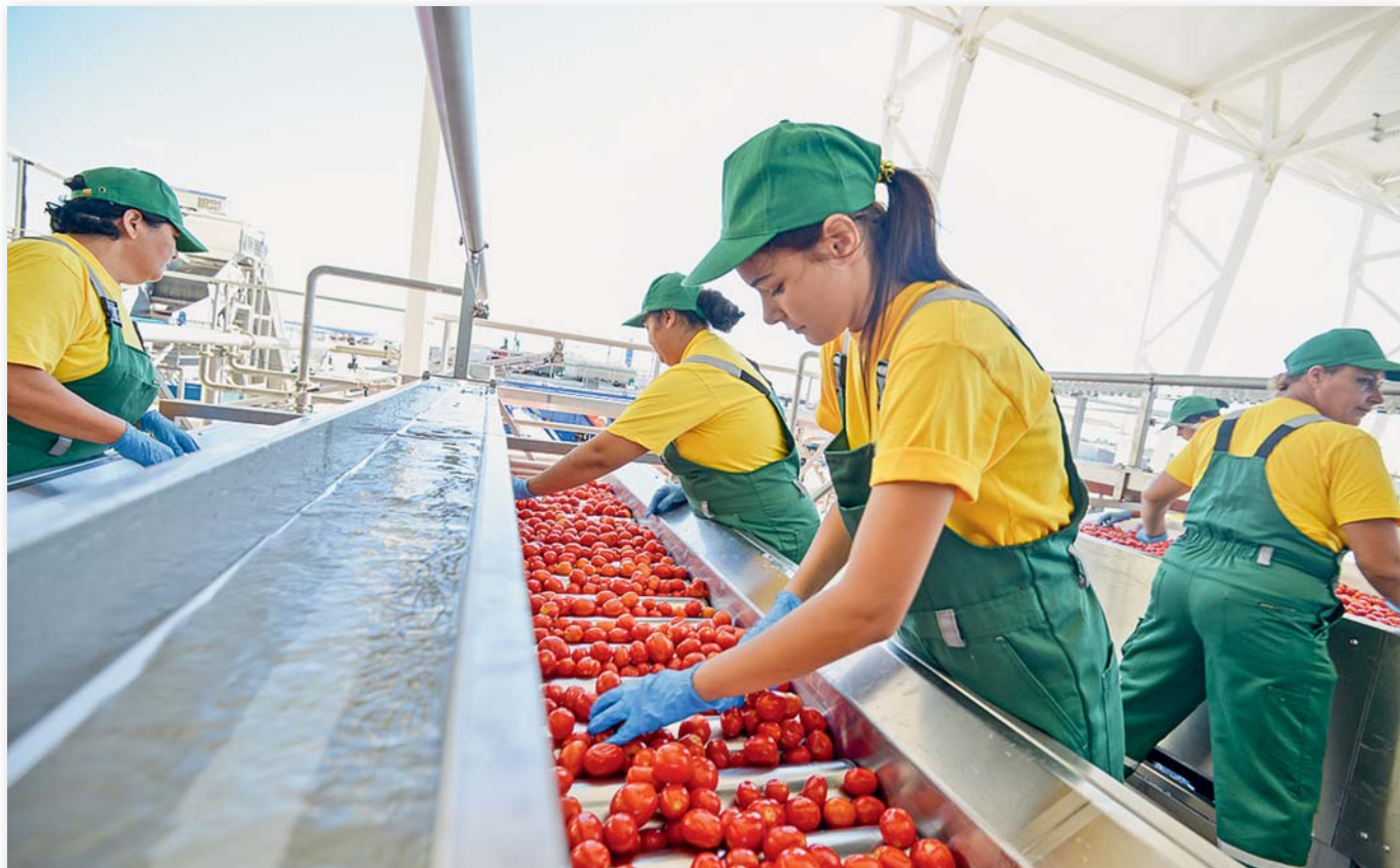
Производство томатной пасты в ООО АПК «Астраханский»

нилище и офисное здание. Все это — первый этап реализации инвестпроекта. В планах у предприятия — увеличение земельного банка и создание новых рабочих мест.