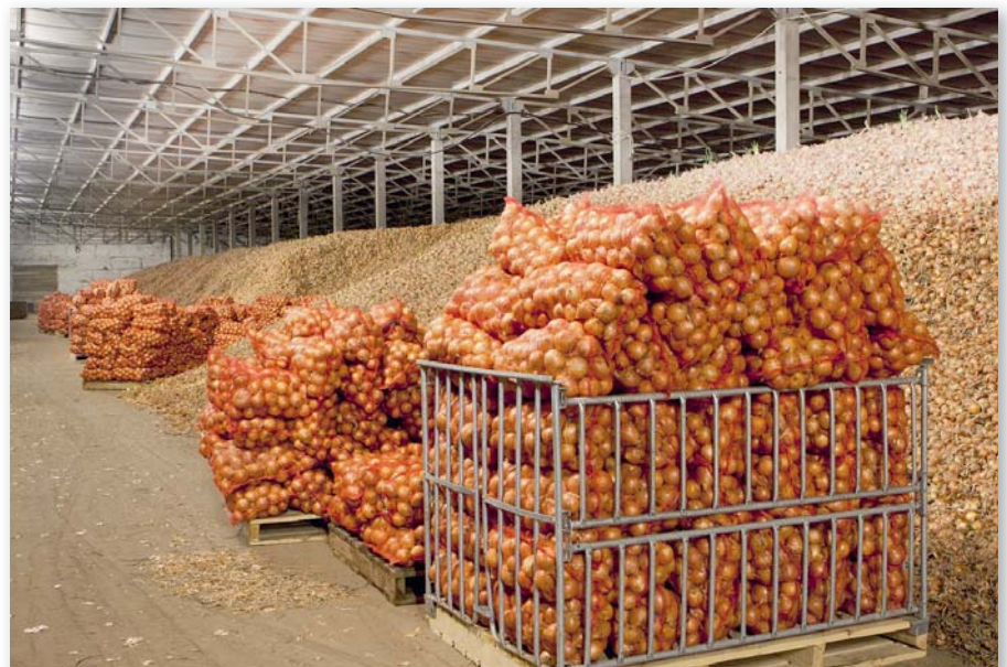
Хранение лука в овощехранилище

Сегодня в регионе функционируют 11 овощеперерабатывающих