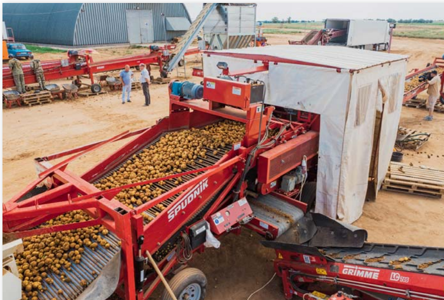
Сортировка картофеля в ООО «МАПС»

предприятий, 5 из которых занимаются консервированием плодоовощной продукции, 2 – производством соевых, 4 – заморозкой. По состоянию на начало ноября объем переработанного сырья составил 441,5 тыс. т (рост – 104% к аналогичному периоду прошлого года). К основным перерабатывающим предприятиям относятся ООО «АПК Астраханский», ООО «Вкусный продукт», ИП ГКФХ Саблина, ООО «ВКОЗ», ООО ПКФ «Астраханские консервы».