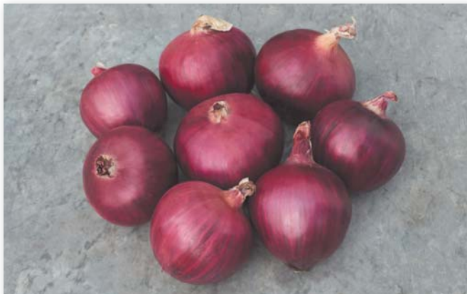
Ред Булл F1